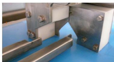
Schneideinheit - Scherenprinzip