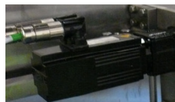
Antrieb - Schneideinheit